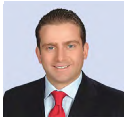
Ömer SELVİ (AK Parti)