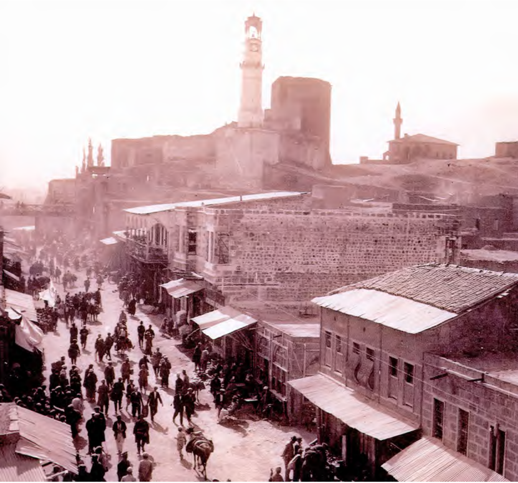
İstasyon Caddesi / 1935