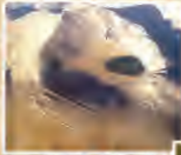
Göllüdağ ve Ören Yeri

Niğde il merkezinin kuzey yönünde olup, il merkezine 60km. Uzaktadır. Kömürcü Köyü yakınında bulunan Göllüdağ, deniz seviyesinden 2172m. Yükseklikte korunaklı bir şehirdir. Volkanik bir dağ olan Göllüdağ'ın zirvesinde bir de krater gölü mevcuttur. Bu krater gölünden dolayı da Göllüdağ olarak adlandırılmıştır.