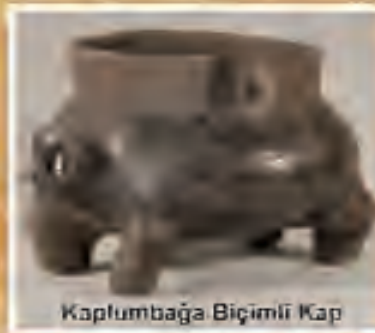
Kaplumbağa Biçimli Kap