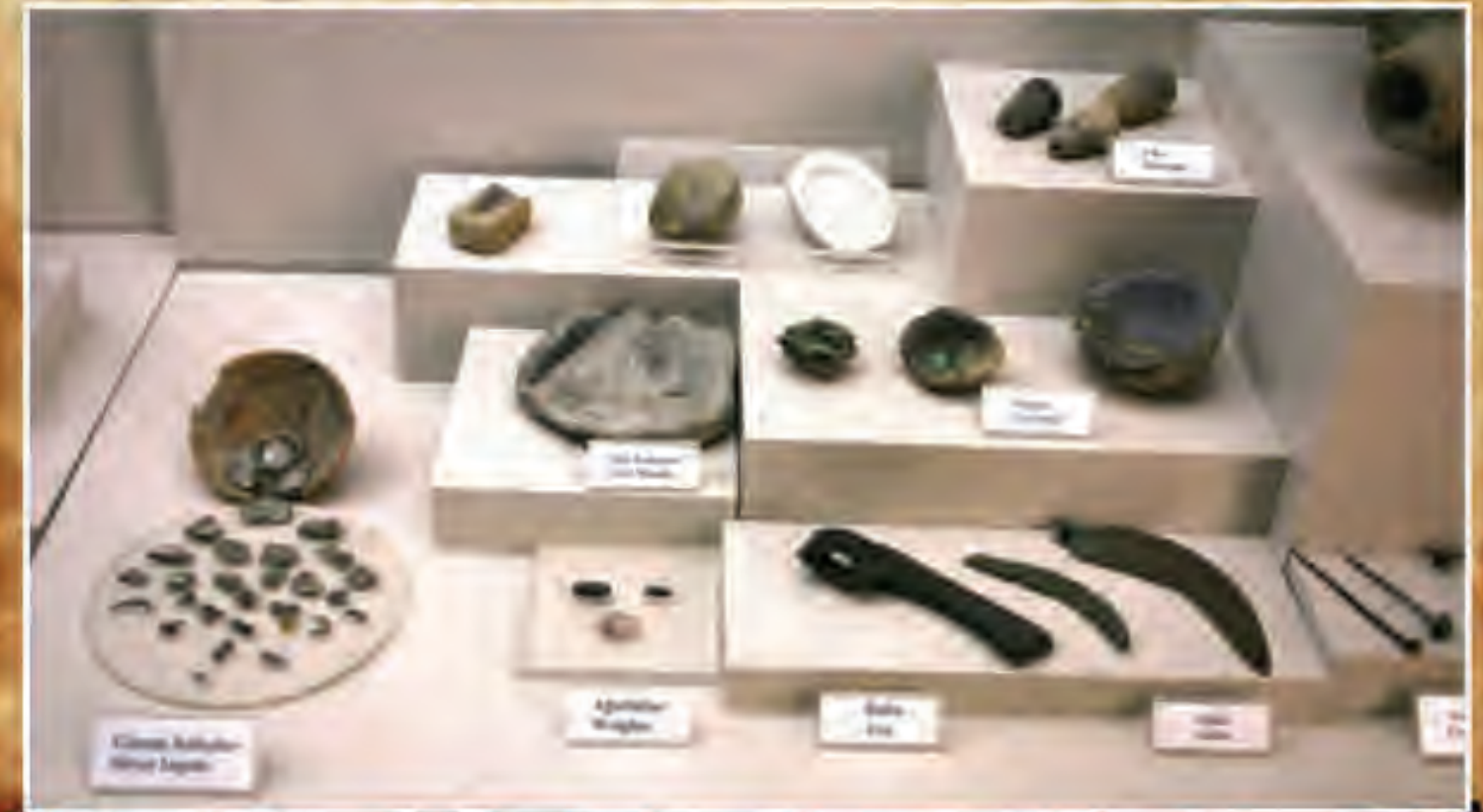
Potalar-Külçeler-Alet Kalıpları ve Madeni Aletler

Gelişmiş bir teknolojinin ürünü olan bu maden Eski Tunç Çağında her türlü aletin, silah ve takının yapımında kullanılmıştır.