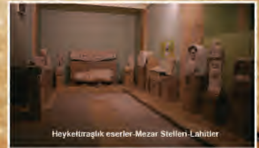
Heykeltıraşlık eserler-Mezar Stelleni-Lahitler

Antik Tyana Kentinde yapılan kazı çalışmalarında; Roma ve Bizans Dönemlerine ait Heykeltıraşlık eserler ortaya çıkartılmış, Vaftiz kilisesi ve hamam yapılarının kazıları bitirilerek restorasyon çalışmalarına başlanmıştır.