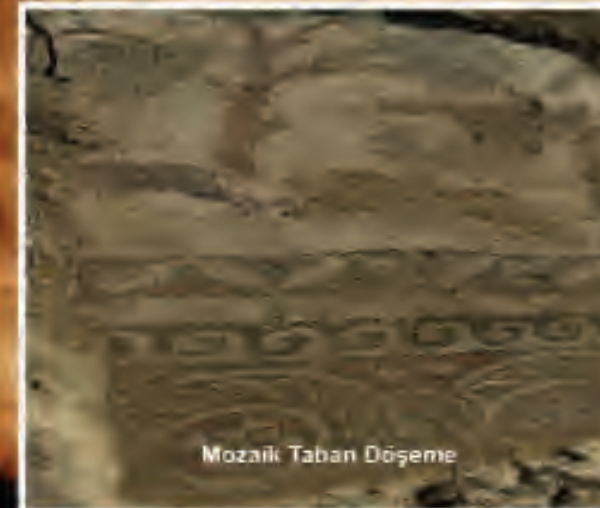
Mozaiik Taban Döşeme