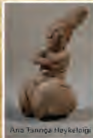
Ara Tanrıça Heykelciği